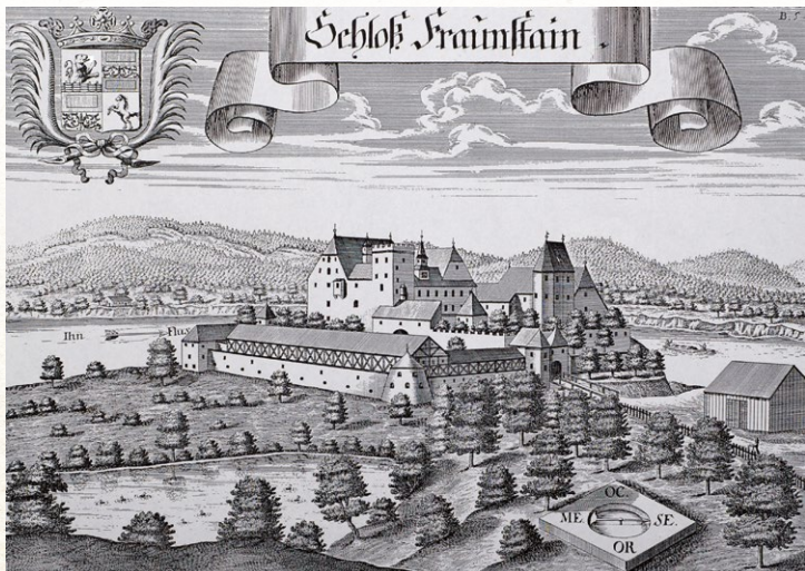
Frauenstein 1721 und heute