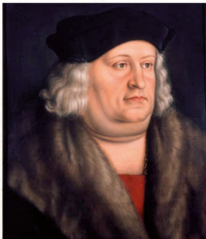
Herzog Albrecht IV.

Burg, welche den Namen in „ Fraunstein “ änderten. Die Anlage befindet sich auf einem gewaltigen Felsvorsprung, der nur heute wegen des Stausees nicht mehr so wahrnehmbar ist.