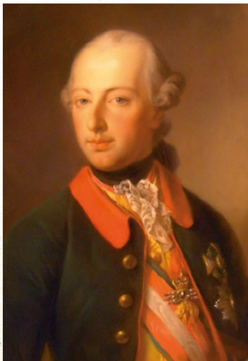
Kaiser Joseph II.

der Trenck suchten die Gegend furchtbar heim. Zu der Zeit war Österreich der Gegner, das Innviertel bei Bayern. Kurfürst Karl Albrecht war mit der Schwester Maria Theresias verheiratet und wollte die Kaiserwürde. Er wurde 1741 zwar Kaiser Karl VII. , starb aber bereits 1745.