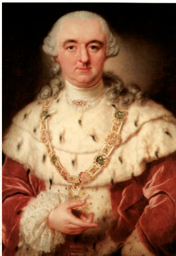
Kurfürst Carl Theodor