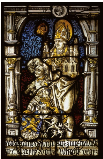
Tafeln der originalen Kirchenfenster von 1524